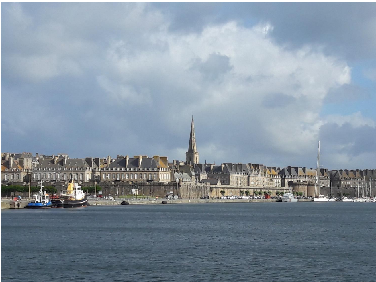
Uitzicht uit 't hotel.