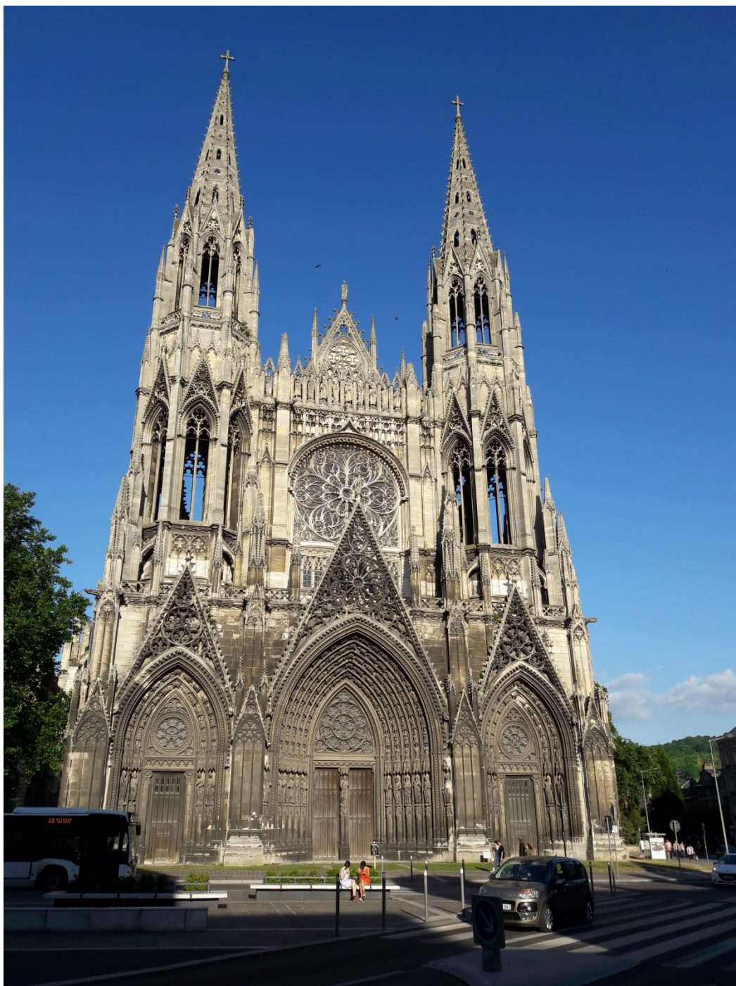
Abbataile Saint-Ouen. Mooi aan de buitenkant, maar vreselijk aan t vervallen.