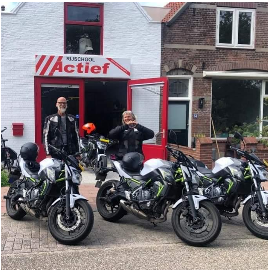
De tweede keer was meer succesvol op 10 augustus 2021.