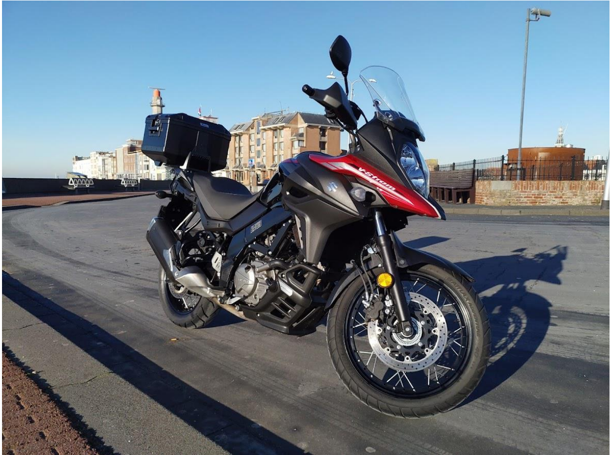
Suzuki DL 650 V-Strom ABS (6473km)

Voor de tourvakantie was het handig om er een koffer bij te nemen (anders kan Vroni echt niet alles meenemen), en een paddock stand voor het onderhoud aan de ketting. Nu moet de deur in de schuur maar gauw komen, want door de achterdeur is niet echt gemakkelijk.